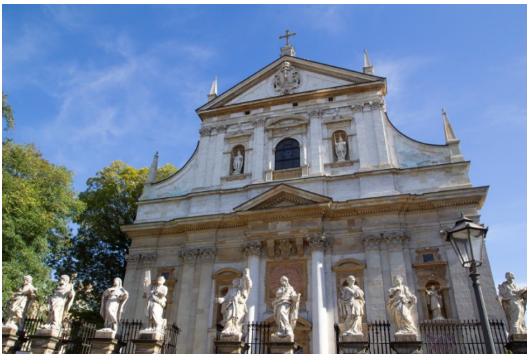
Kościół Św. Piotra i Pawła